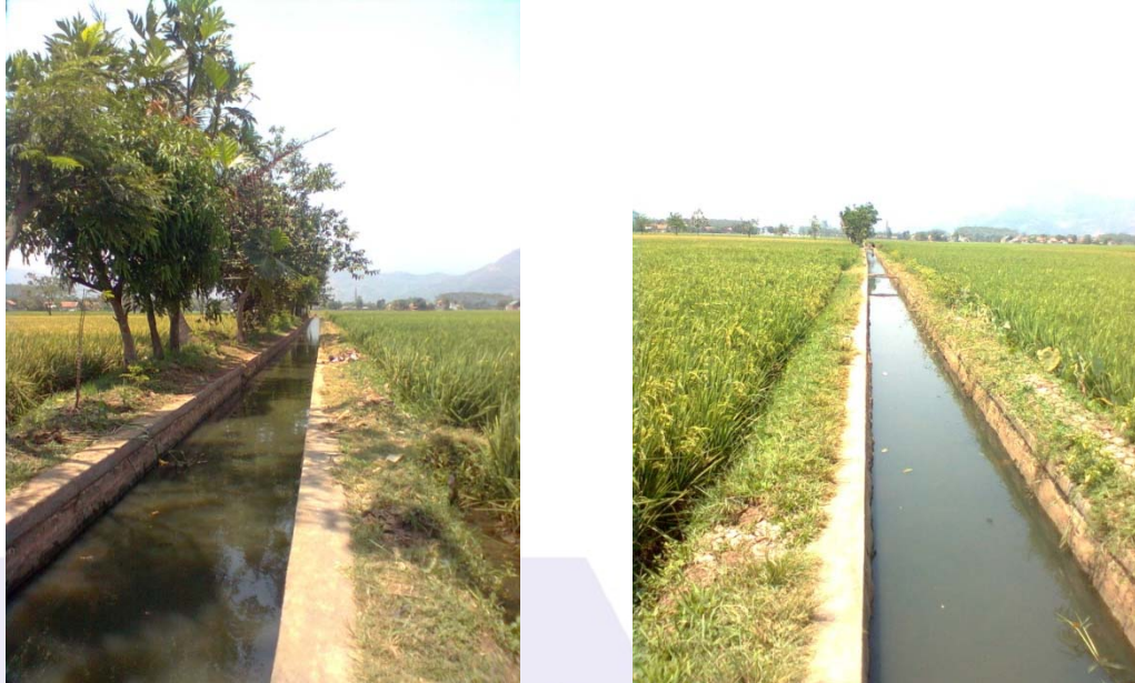
Gambar 3 – Contoh buffer zone berbentuk parit