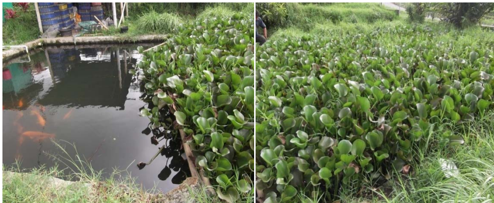
Gambar 4 – Contoh kolam penampungan untuk filterisasi kontaminan