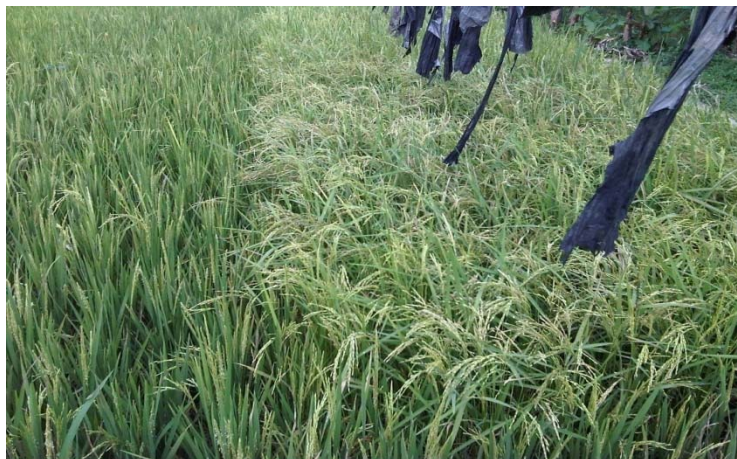
Gambar 2 – Contoh tanaman penyangga pada tanaman semusim